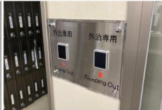
ICチップ内蔵のルームキー