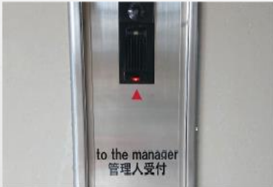
玄関オートロック