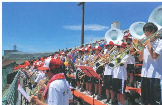
長野大会で選手たちの士気を鼓舞する吹奏楽（平成25年7月）