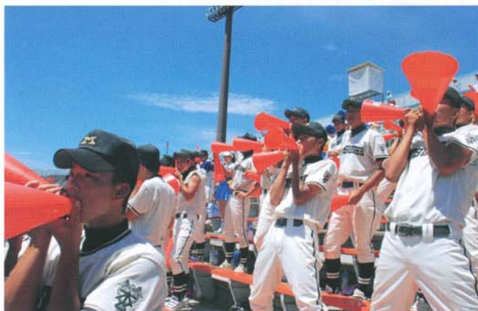
赤いメガホンを振って必死の声援（平成25年7月）