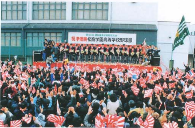
大勢のびびとに祝福された準優勝祝賀会 (平成3年4月6日)