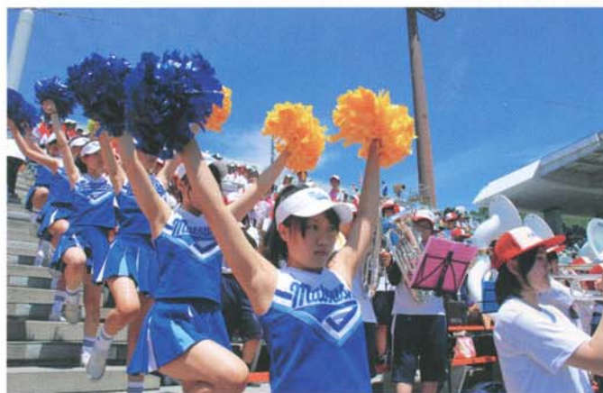
鮮やかなコスチュームが躍るバトン（平成25年7月）