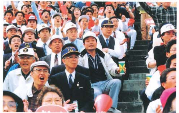
スタンドで応援する吉村午良長野県知事や和合正治松本市長 (Mのマークの紺色の帽子)