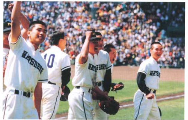
強いと言われた相手をつぎつぎと破る(大阪桐蔭戦4月3日)