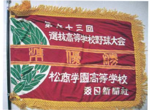
夢と感動の選抜準優勝旗