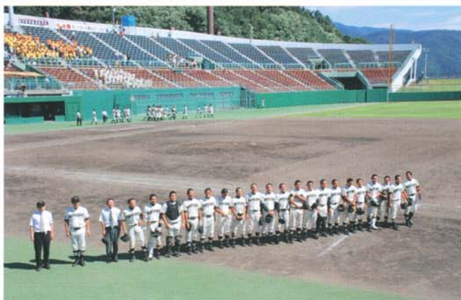
「応援ありがとう」支えてくれる人たちに感謝の挨拶（平成25年7月）