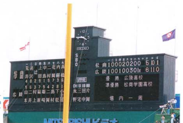
広陵との65年ぶりの決勝対決に惜敗 (平成3年4月5日)