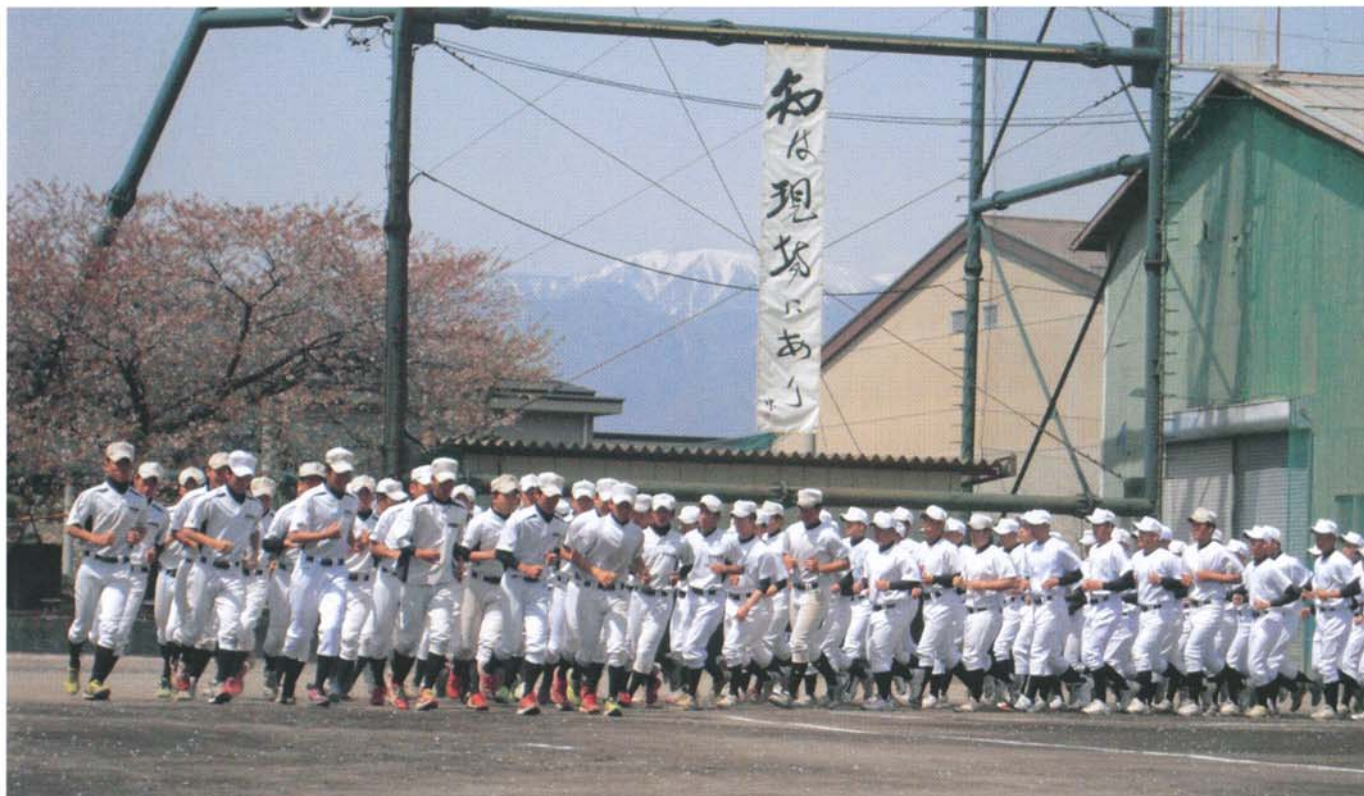
平成25年春、101年の第一歩を踏み出す