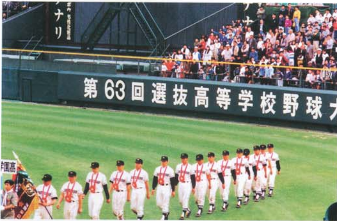
準優勝メダルを首にかけ準優勝旗を掲げて場内一周